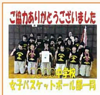
チームの集合写真を入れたもの