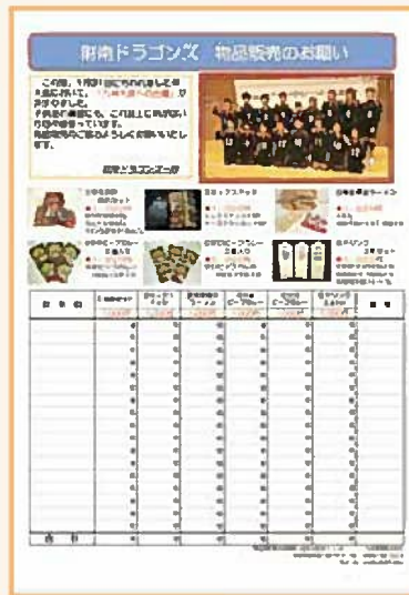
▲写真あり片面 (商品案内+注文書)